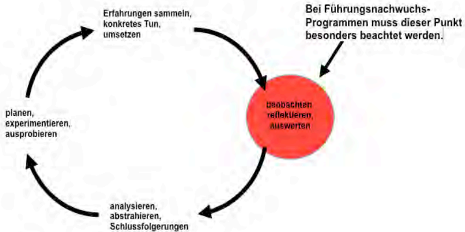
Der Lernkreis nach David C. Kolb

Bei Sennheiser war diese Erkenntnis für die Lerngruppe ein entscheidender Schritt: Wann muss der Handlungsimpuls der Gruppe gestoppt und der notwendige Reflexionsimpuls gesetzt werden? Anfangs mussten dies die Projektcoaches tun, später wurde innerhalb der Gruppe eine Person benannt, die kontinuierlich diese Reflexion einforderte.